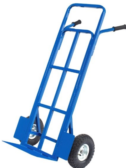
Рис.1 - Тележка ручная КГ 350.

Тележки ручные предназначены для перевозки насыпучих, среднегабаритных и мелкогабаритных упакованных и неупакованных грузов на небольшие расстояния. Область применения тележек – производственные и складские помещения, торговые залы, предприятия общественного питания и т.д.