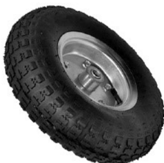
Рис. 4 - Колесо пневматическое