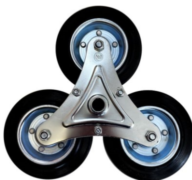
Рис. 5- Специальные колеса для лестниц