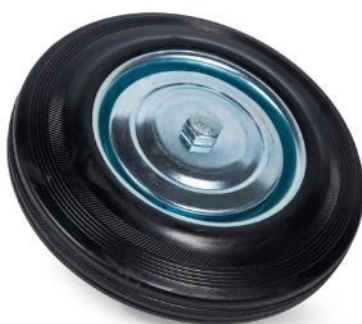
Рис. 3 - Колесо резиновая покрышка.