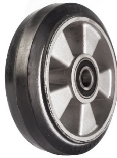
Рис. 6- Большегрузные колеса 180мм